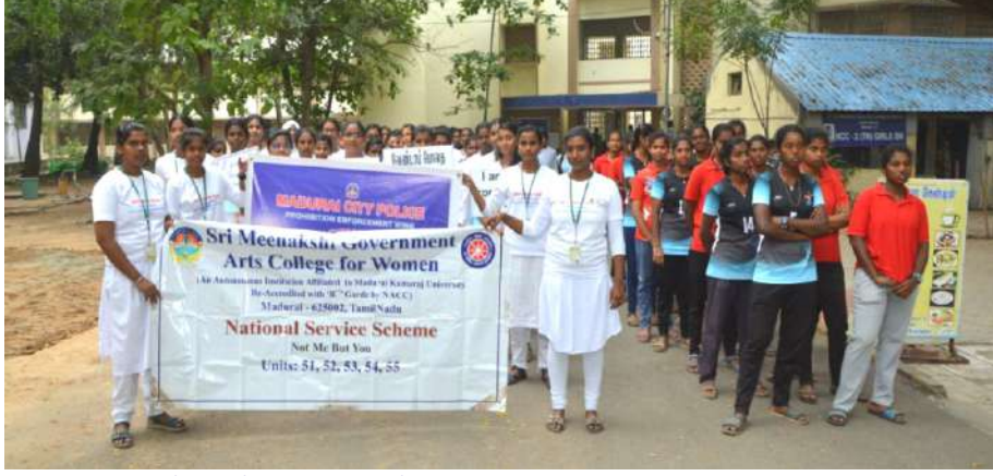
தேசிய ஒருமைப்பாட்டு முகாம்