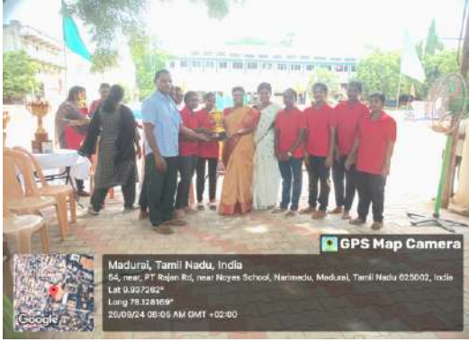
பல்கலைக் கழக பூப்பந்து போட்டியில் 3-ம் இடம்