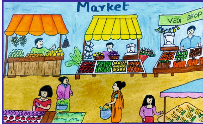
I.Jahara Imrana III BA.Economics (TM)