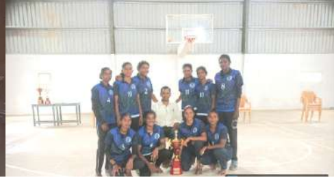
பல்கலைக்கழக கபாடி போட்டியில் 3-ம் இடம்