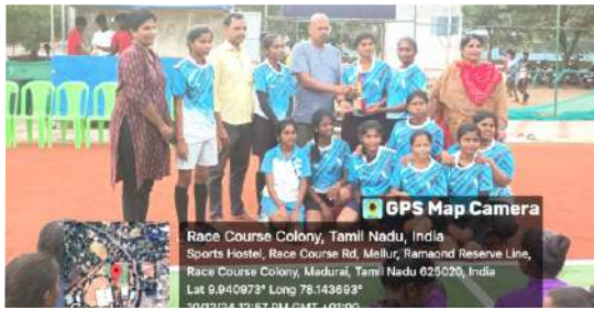
பல்கலைக்கழக வளைகோல் பந்து போட்டியில் 3-ம் இடம்