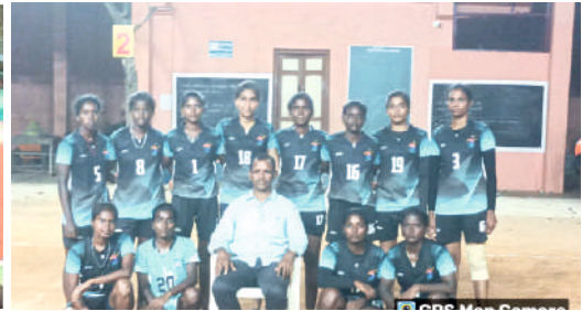
பல்கலைக்கழக கையுந்துப்பந்து போட்டியில் 3-ம் இடம்