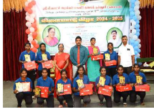
அகில இந்திய பல்கலைக்கழக பல்வேறு போட்டிகளில் பரிசு பெற்ற மாணவிகள்